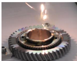
パワートレイン溶接